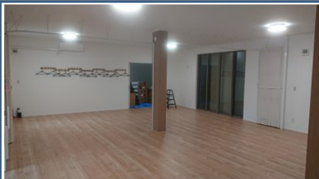
【会議室(倉庫側方向)の様子】