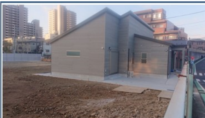
【南東側道路から見た様子】