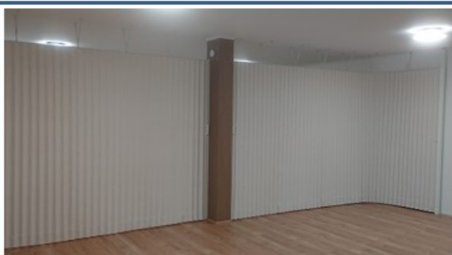
【会議室(倉庫側から見た)の様子】